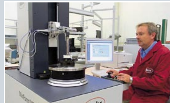
Inbetriebnahme eine Formtesters unter Klimabedingungen – Elektronik und Mechanik wirken zusammen.

Sartorius Electronics, Göttingen, Tel. 0551/308-0, Fax 308-3289, www.sartorius.com