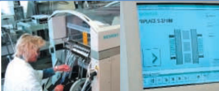
Einfaches Handling: Sartorius-Mitarbeiterin bei der Einrichtung einer SIPLACE SMD-Linie.