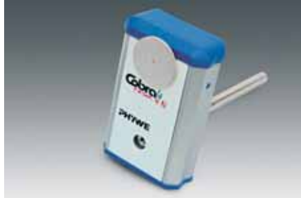
Cobra4 Sensor-Unit Kraft, von oben mit eingestecktem Teller.

Schwebung am gekoppelten Pendel. Deutlich ist das gegenseitige Aufschaukeln der Schwingungen zu sehen, was durch den Energietransfer der Teilsysteme erklärt werden kann.