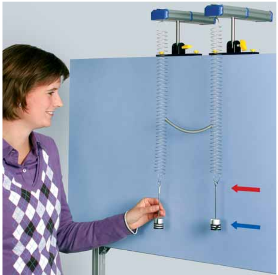
Experiment mit 2 Kraftsensoren zum gekoppelten Pendel, eines der grundlegenden Experimente der Mechanik, das in das Gebiet der Differentialgleichungen führt.

Mit Cobra4 betritt auch die Phywe Neu-land: ein möglicher Übertragungsweg vom Experiment zum PC ist wireless! „Mit Cobra4 können Experimente im Bereich Physik, Chemie und Biologie in nie da gewesener Art und Weise durchgeführt werden“, so der Originaltext aus der Produktbroschüre der Phywe. Computergestützte naturwissenschaftliche Experimente sind damit nicht mehr unmittelbar an den PC-Standort gebunden. Damit gelingt es beispielsweise die Schüler intensiver am Unterrichtsgeschehen zu beteiligen und damit das Interesse an Naturwissenschaften und deren Verständnis zu fördern.