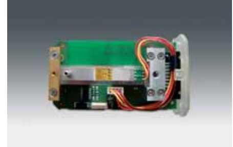
Elektronikbaugruppe des Cobra4 mit DMS Biegebalken

Die Cobra4 Sensoren zu Kraft enthalten einen Biegebalken (DMS-Technologie), der die mechanische Belastung in ein elektrisches Signal umsetzt. Die Sensoren können je nach Anwendungsart an ein Handbediengerät oder einen PC angeschlossen werden. An der Oberseite des Gehäuses kann ein Teller zur Messung